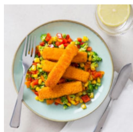
Barrinhas com Salada Colorida