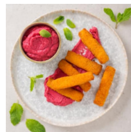
Barrinhas com Húmus de Beterraba e Grão