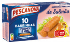
Barrinhas de Salmão Panado Sem Glúten