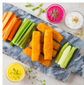
Barrinhas com Crudités e Molhos Para Dipar