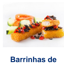
Barrinhas de Pescada no Forno com Azeitonas e Pimento