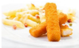
Barrinhas Ómega 3 com Penne de Ervilhas e Bacon