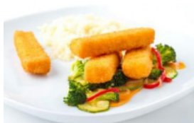
Barrinhas Ómega 3 no Forno em Cama de Legumes Salteados