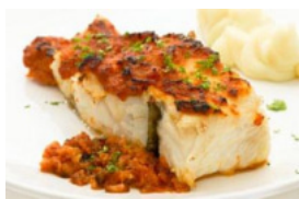
Bacalhau à Pescanova