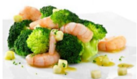
Brócolos com Miolo de Camarão