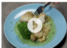
Bacalhau no Forno à Pescanova (Vídeo)