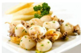
Choquinhos à Algarvia