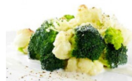
Couve-Flor e Brócolos Gratinados