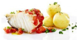
Bacalhau à Portuguesa