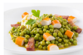
Delícias do Mar com Ovos Escalfados