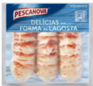
Delícias com Forma de Lagosta 255 g