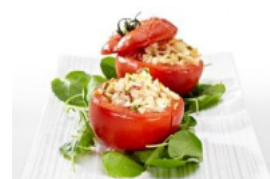
Cestos de Delícias do Mar