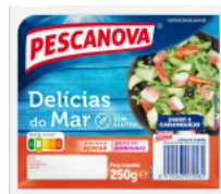
Delícias do Mar Sem Glúten 250 g