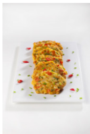
Bolinhos Asiáticos de Delícias do Mar