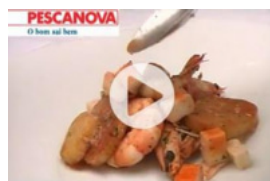
Delícias do Mar com Camarões al Ajillo e Sidra