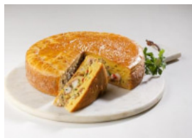
Bolo de Delícias do Mar