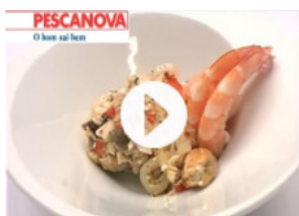
Cocktail de Marisco