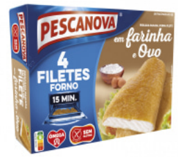
Filetes Forno em Farinha e Ovo, Sem Glúten