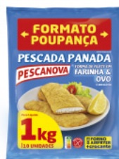
Pescada Panada Forma de Filete em Poime Sem Glúten