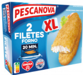
Pescada Panada em Forma de Filete XL