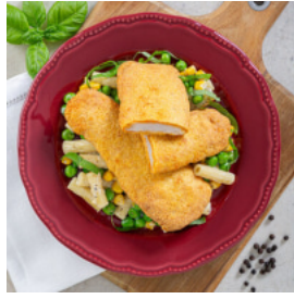
Filetes de Pescada Panada Sem Glúten com Massa Cremosa de Ervilhas e Milho