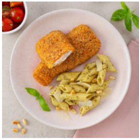
Filetes Forno de Tomilho e Sal Marinho com Macarronete ao Pesto de Manjericão