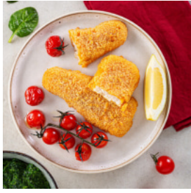
Filetes de Limão com Esparregado e Tomate Cereja Confitado