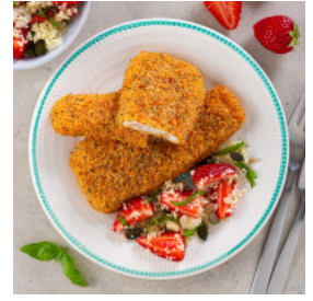
Filetes Forno de Tomilho e Sal Marinho com Cuscuz de Verão