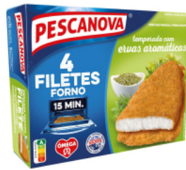
Filetes Forno com Ervas Aromáticas