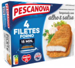
Filetes Forno com Alho e Salsa