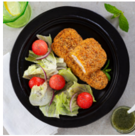
Filetes Forno de Tomilho e Sal Marinho com Salada de Verão