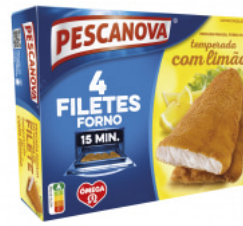
Filetes Forno com Limão