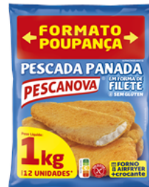
Pescada Panada Forma de Filete Sem Glúten