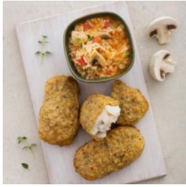
Mimos de Pescada com Arroz de Cogumelos e Tomilho