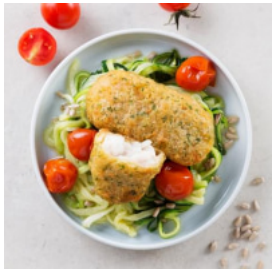
Mimos de Pescada Panada com Zoodles e Tomate Cereja