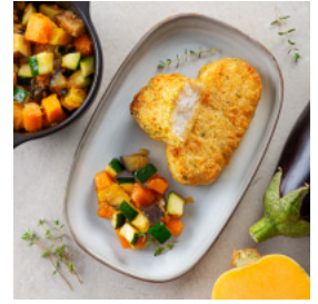
Mimos de Pescada Panada com Salteado de Outono