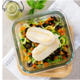
Mimos de Pescada do Cabo com Zoodles Salteados ao Manjericão