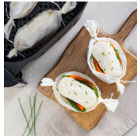
Papelotes de Mimos de Pescada com Juliana de Legumes na Air Fryer