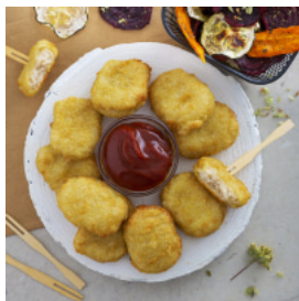
Nuggets de Frango com Chips de Legumes e Ketchup Caseiro