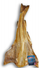
Bacalhau Cura Amarela