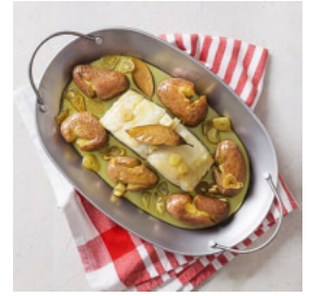
Bacalhau à Lagareiro