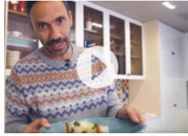
Bacalhau à Canela e Hortelã com Maçã by Pedro Ribeiro