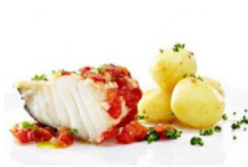
Bacalhau à Portuguesa