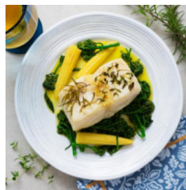
Bacalhau ao Alecrim e Tomilho com Bimis e Mini-Milhos