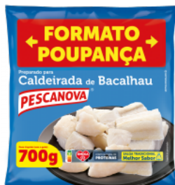
Preparado para Caldeirada de Bacalhau