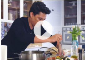
Açorda de Bacalhau à Alentejana by Vasco Palmeirim