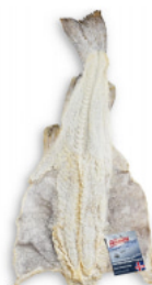
Bacalhau Salgado Seco - Islândia