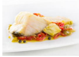
Bacalhau à Grega com Pimentos e Alcachofas