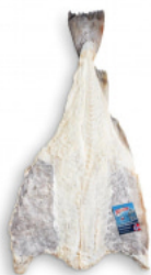
Bacalhau Salgado Seco - Noruega