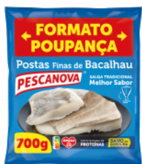
Postas Finas de Bacalhau