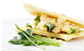
Folhado de Pescada