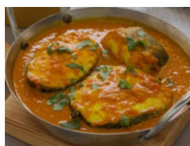
Caril de Pescada