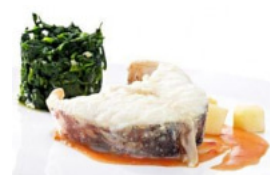
Pescada ao Madeira