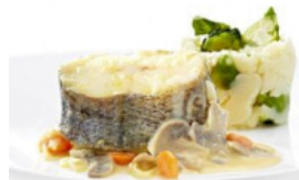
Pescada à Nossa Moda