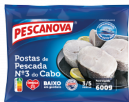
Postas de Pescada nº 3 do Cabo 600 g