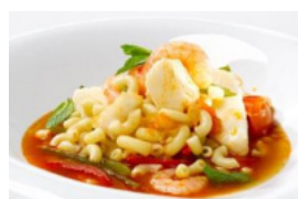
Massada de Peixe e Camarão Pescanova