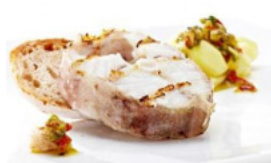
Pescada à Moda do Crato