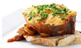
Pescada à Grega