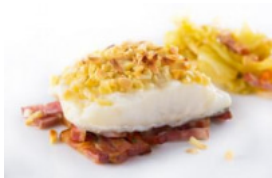
Bacalhau Assado com Crocante de Amêndoa em cama de Bacon e Couve