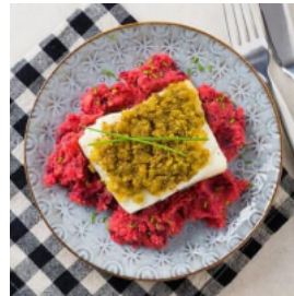
Bacalhau com Crosta de Broa e Pesto de Manjeriçã