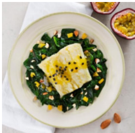
Bacalhau com Molho de Maracujá e Espinafres aos Frutos Secos