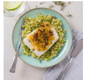
Bacalhau no Forno com Broa e Tomate-Seco