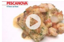
Bacalhau com Camarão e Passas