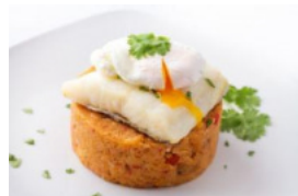
Bacalhau em Tempos de Frio