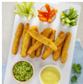
Tábua de Tiras de Frango com Dois Dips