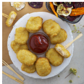
Nuggets de Frango com Chips de Legumes e Ketchup Caseiro