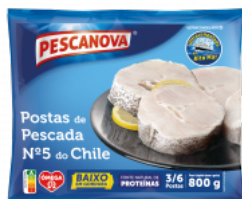
Postas de Pescada nº 5 do Chile 800 g