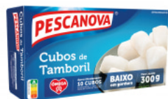
Cubos de Tamboril 300 g 300 g