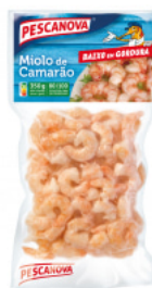
Miolo de Camarão 80/100 350 g