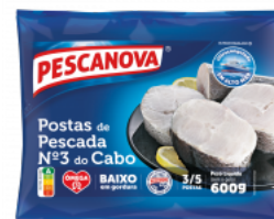
Postas de Pescada nº 3 do Cabo 600 g