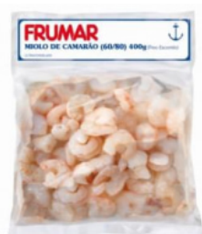
Miolo de Camarão Frumar 400 g