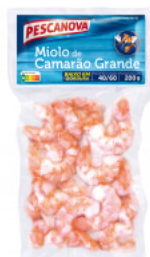
Miolo de Camarão Grande 40/60 200 g